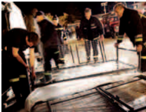
Sopra i volontari partiti dal Trentino impegnati ad allestire una struttura mobile. A destra unità cinofile della nostra provincia impegnate in Abruzzo