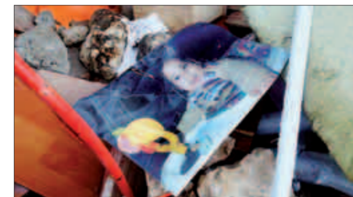
L'immagine di un bimbo sorridente in mezzo alle macerie

fango alto venti centimetri, anfibii rosa laccati. Non solo loro, anche tra i soccorritori ci sono coloro che paiono usciti da pellicole americane. Molti sono gli occhioletti, Rayban a goccia e Revo, spesso sulla nuca. Perché è lì che servono, perché è così che hanno insegnato gli americani! Poi, molti 30-40enni, vestono le braghette Montura e in bocca hanno quel fare decisionista. Sono di solito questi volontari che di tanto in tanto vanno a chiamare quei reporter. E suggeriscono loro questa o quella «carineria», questa o quella «cazzatella»: lì stanno e poi si mettono lì pronti ad essere inquadrati o anche intervistati. Tanto che poliziotti e carabinieri hanno il loro bel da fare per scovare i giornalisti con baschetto o anche con la foto, con gli occhioletti sulla nuca e la braghetta bella: questa è una data storica. O no? R.M.G.