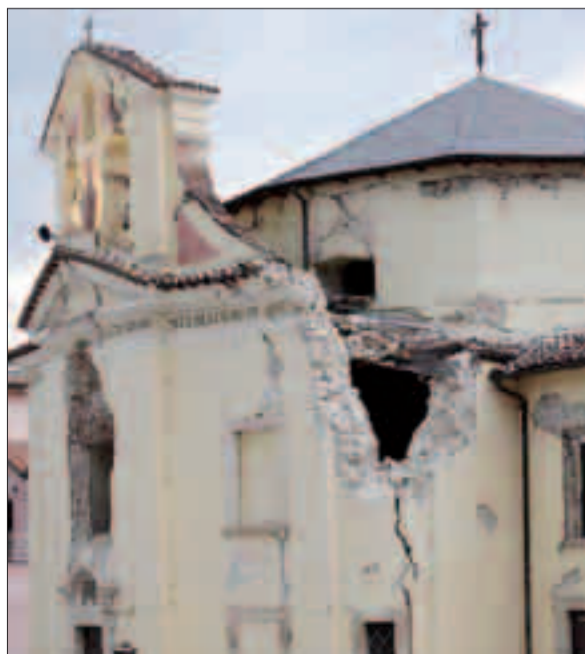
La chiesa di Paganica semidistrutta dal terremoto