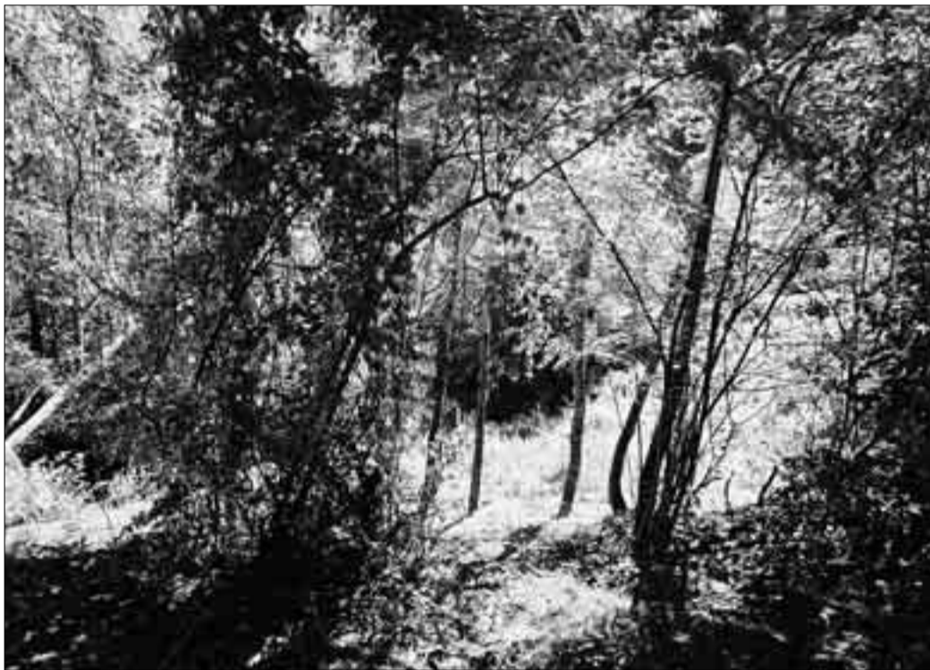
SOCORSI. A fianco, in senso orario, il luogo in cui è scivolato l'uomo, il cesto dei funghi e il cane da ricerca Atzilla