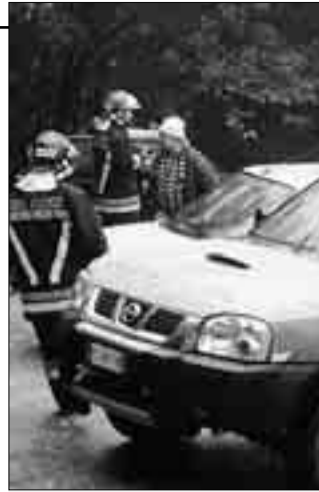
L'organizzazione dei soccorsi