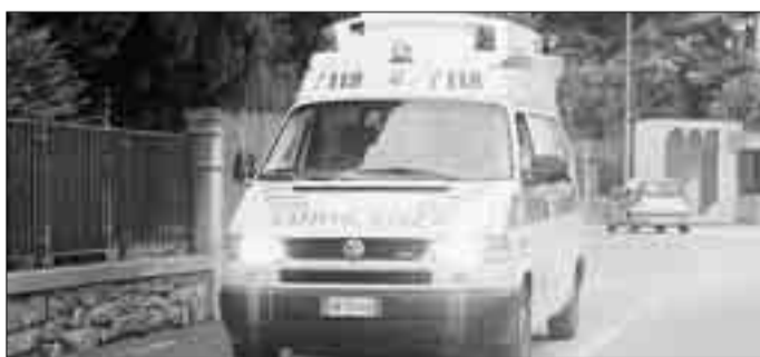
Per una lite tra fratelli è intervenuta l'ambulanza

Ieri la tensione si è ulteriormente alzata e nel campo del fratello che risiede nel paese